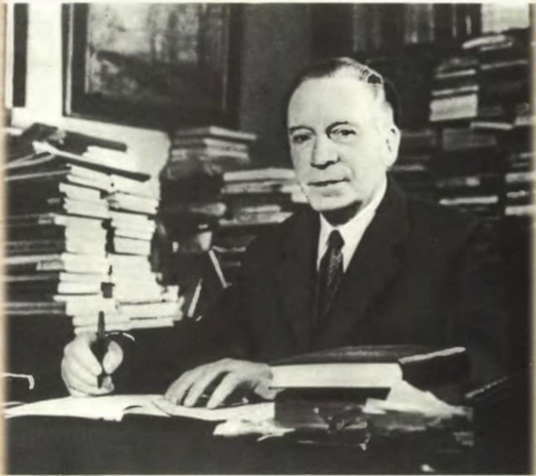
Последняя фотография А. Л. Чижевского. 1963 г.

звания Константина Эдуардовича граничили с мистикой. В то же время всюду была и оставалась до конца материя, ее эволюция и лучистая ее форма. Это было вполне материалистично и, следовательно, никакой мистикой такого рода мировоззрение не обладало. Это я хочу особенно отметить, ибо с первого взгляда может показаться, что данная концепция К. Э. Циолковского метафизична. Обдумывая эту концепцию, я должен был прийти к выводу, что Константин Эдуардович как человек науки не погрешил против основного тезиса передового воззрения и оставался, даже в самых необычайных построениях, человеком прогрессивным — материалистом в лучшем смысле этого слова.